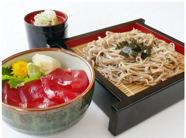
蕎麦/うどんと選べる小丼セット