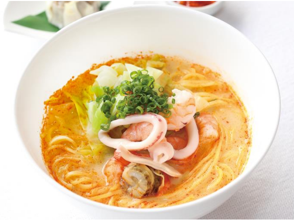
海鮮豆乳ラーメン 1,540円

コラーゲン入り豆乳ベースと鶏がらブイヨンを合わせたスープと、ちぢれ旨こし麺との相性をお楽しみ下さい。