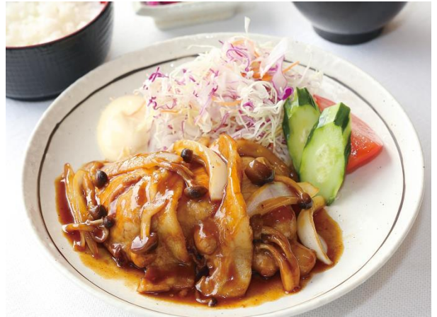
もち豚ロース肉の生姜焼き膳 1,870円

柔らかい薄切りロース肉を特製から甘ダレで仕上げました。ご飯にぴったりの一品です。