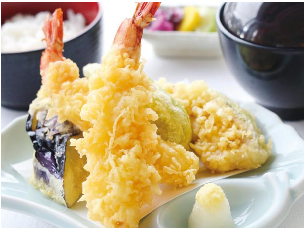
海老と秋野菜の天ぷら膳 1,870円

柔らかい薄切りロース肉を特製から甘ダレで仕上げました。ご飯にぴったりの一品です。